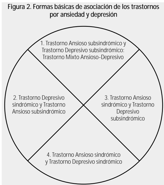
Figura 2. Formas básicas de asociación de los trastornos por ansiedad y depresión

El 29,5% de los pacientes con trastorno de ansiedad tienen un trastorno depresivo a lo largo de su vida y es más frecuente en pacientes con trastorno de pánico .